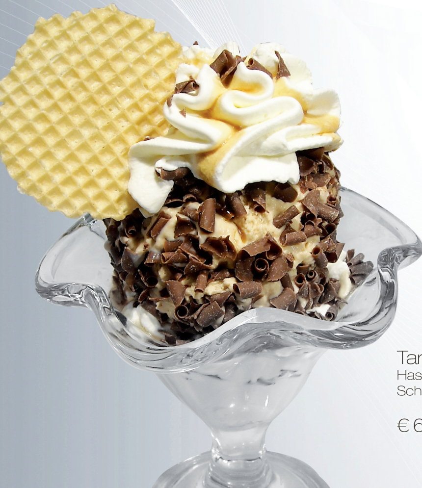
Tartufo (G,A,H) Haselnusseis, Schlagobers, Schokospäne und Amaretto Likör