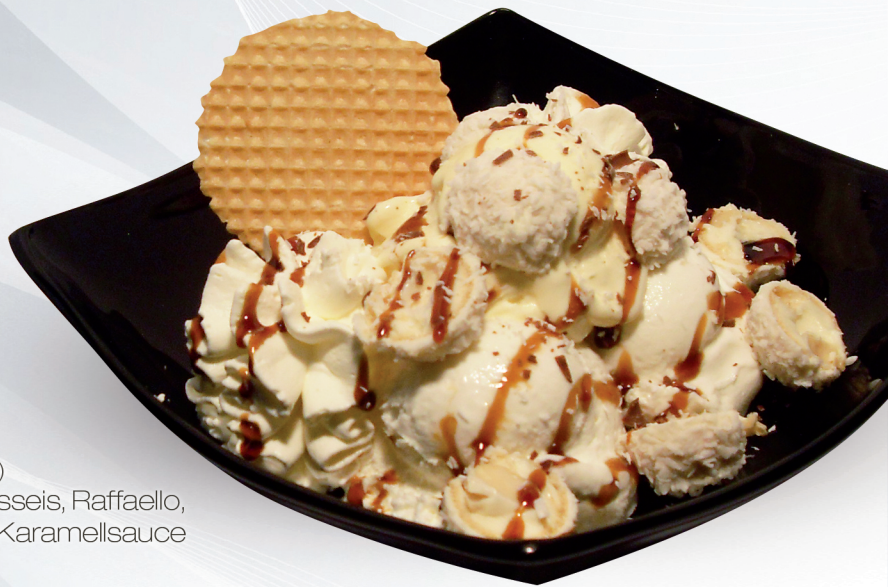
Raffaello (G,A,H) Raffaello-Haselnusseis, Raffaello, Schlagobers und Karamellsauce