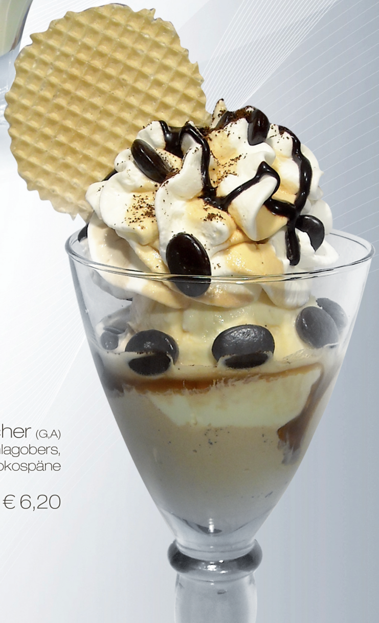
Mocca Becher (G,A) Kaffee-Vanilleeis, Schlagobers, Kaffee-Likör, Schokospäne