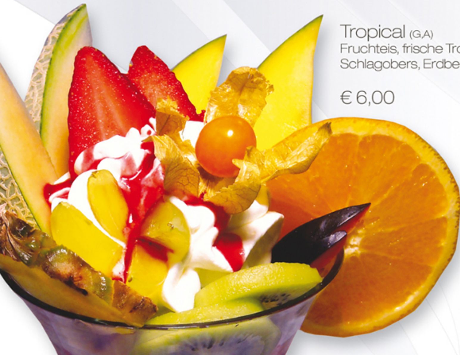
Tropical (G,A) Fruchteis, frische Tropical Früchte, Schlagobers, Erdbeersauce