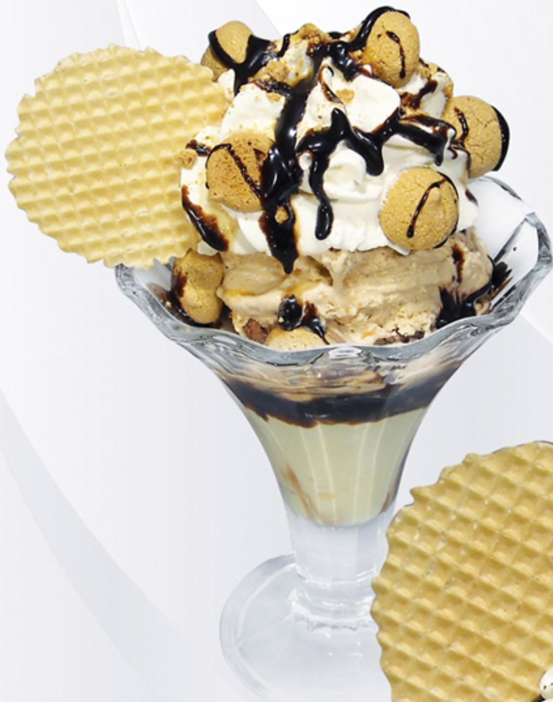
Amaretto Coup (G,A,H) Vanille-Haselnusseis, Amaretti, Schlagobers, Korokant und Amaretto Likör