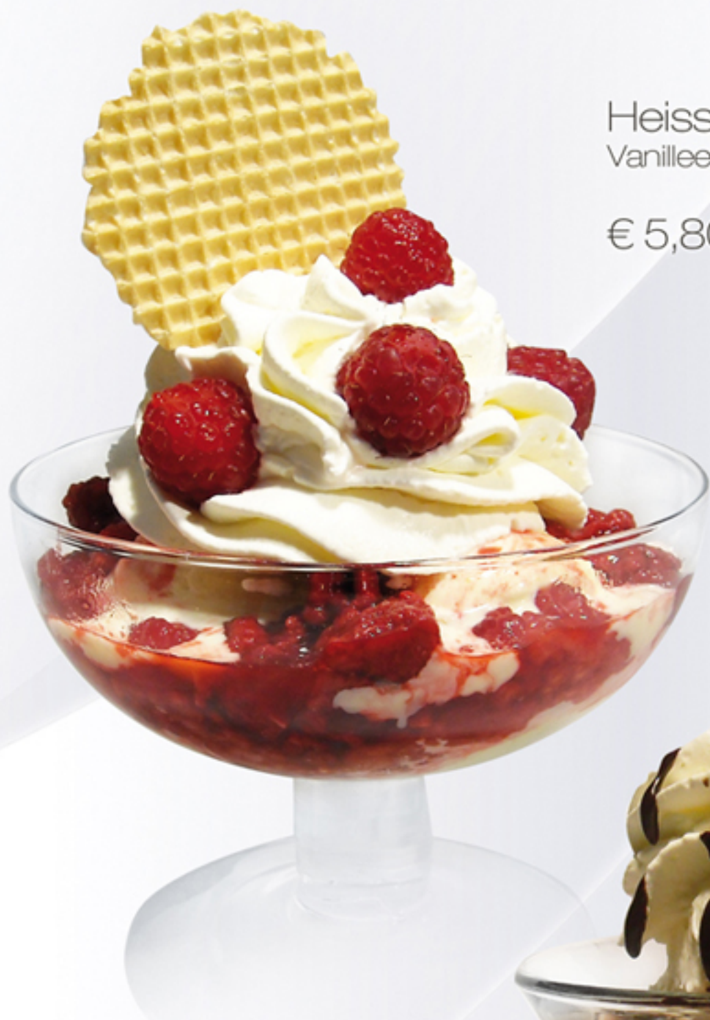
Heisse Liebe (G.A) Vanilleeis, heiße Himbeeren, Schlagobers