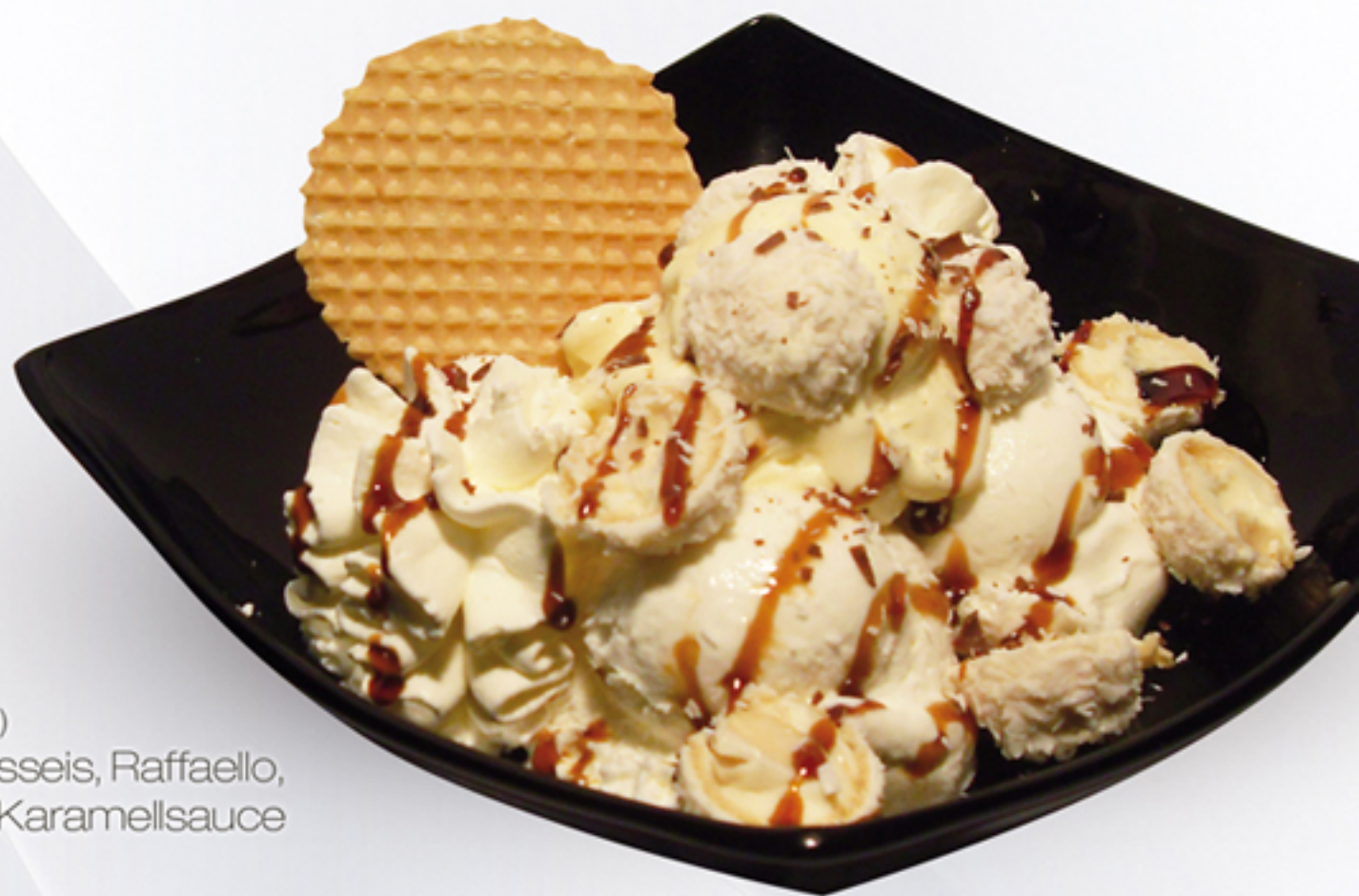
Raffaello (GA,H) Raffaello-Haselnusseis, Raffaello, Schlagobers und Karamellsauce