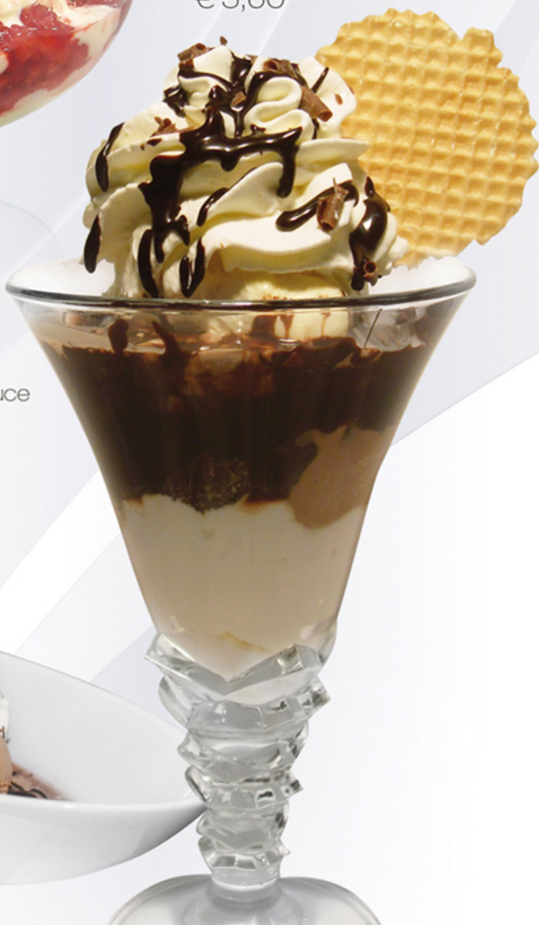
Trüffel (G.A) Schokoeis, Schlagobers, Kirschlikör und Schokosauce