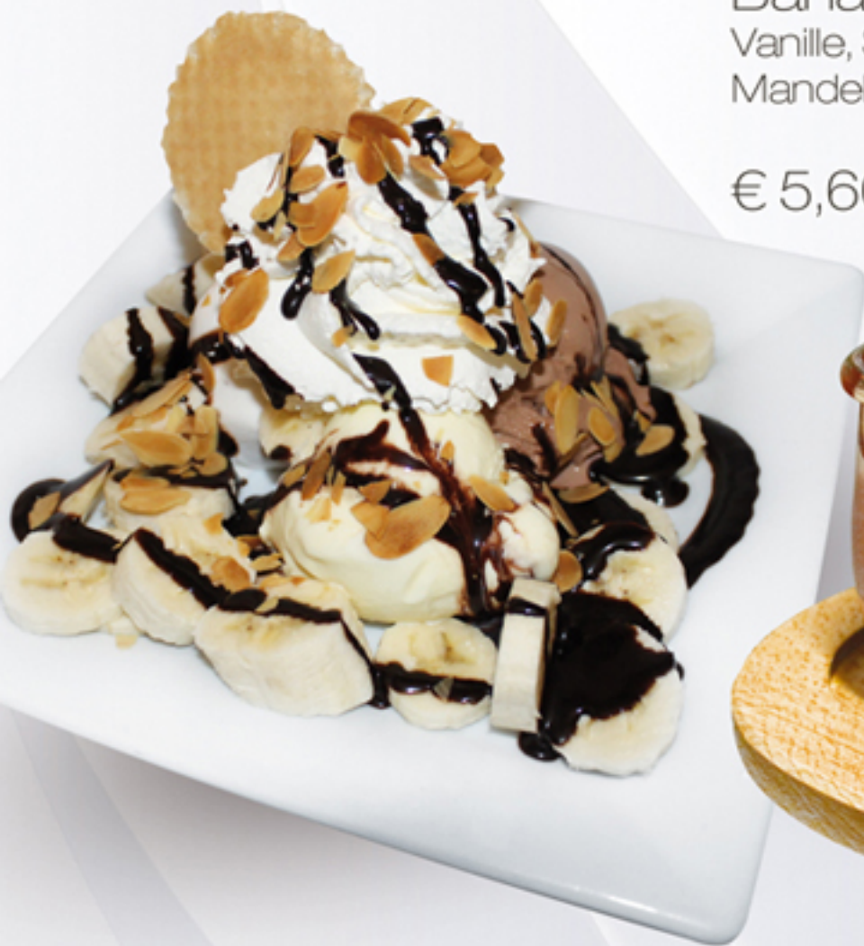
Bananensplit (G,C,H) Vanille, Schoko und Bananeneis, Schlagobers, Mandelblättchen und Schokosauce