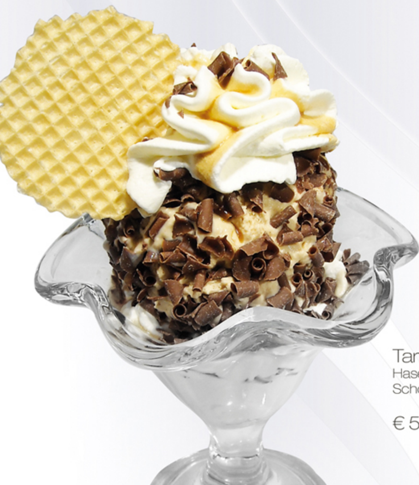
Tartufo (GA,H) Haselnusseis, Schlagobers, Schokospäne und Amaretto Likör