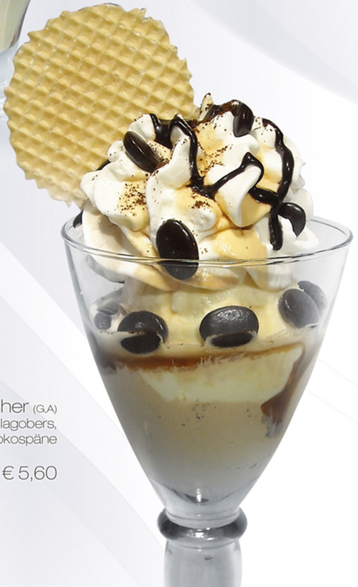
Mocca Becher (G,A) Kaffee-Vanilleeis, Schlagobers, Kaffee-Likör, Schokospäne